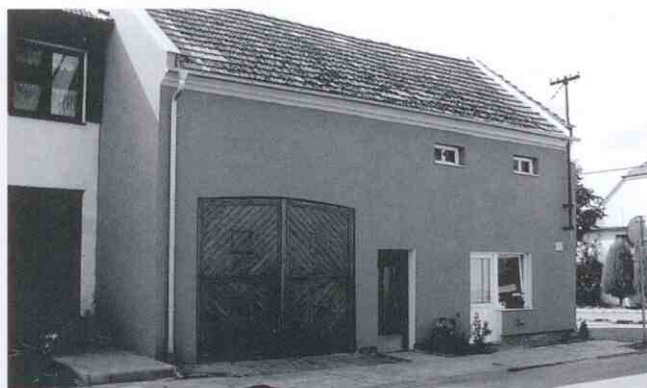
Rodinný dům č.p. 2 dříve a nyní – nový kabát mu sluší. A slušel by mu i od severu.