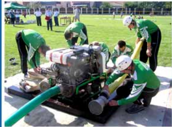
Sbor dobrovolných hasičů