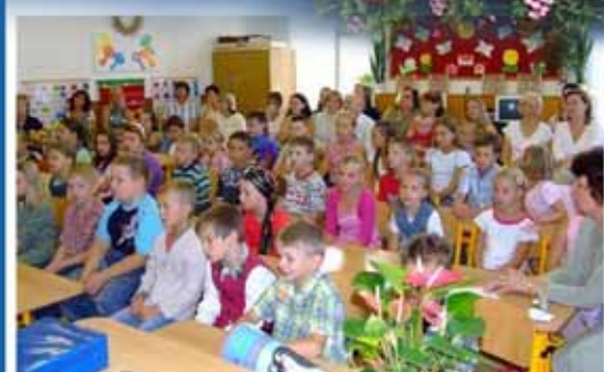
Ze školních lavic

Hodové dozvuky aneb Babské hody se uskuteční o 2-3 týdny později. výbor O.S.K.CH.