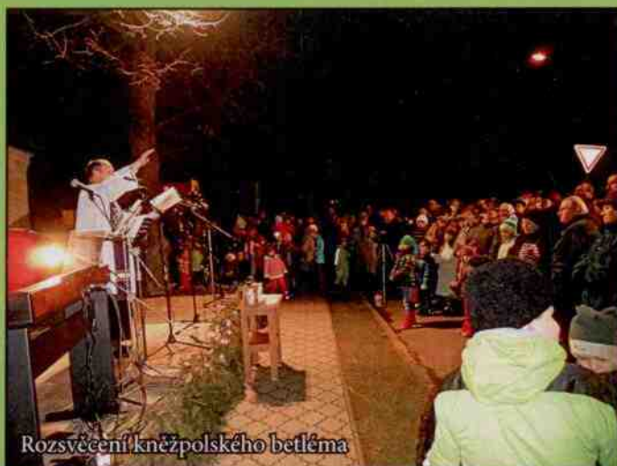
Rozsvěcení kněžpolského betléma