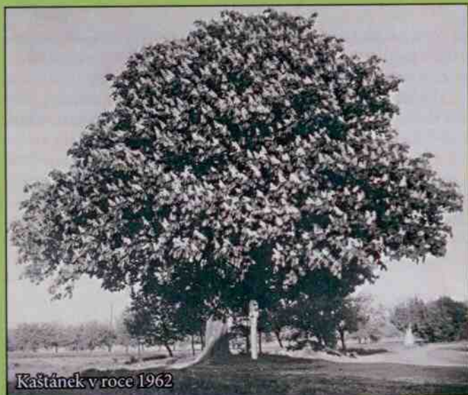
Kaštánek v roce 1962