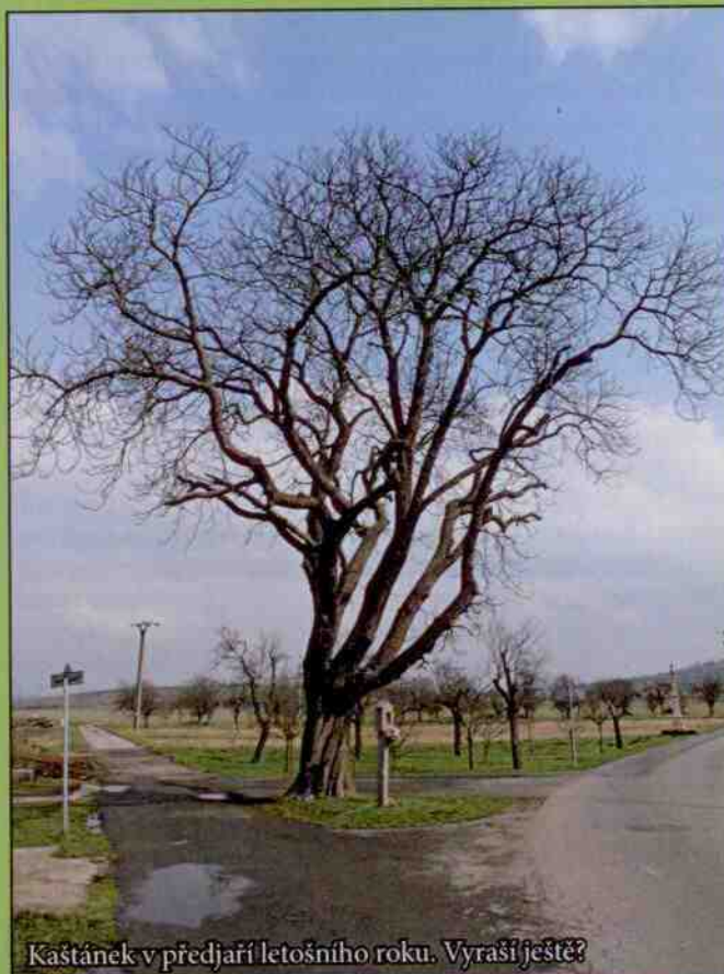
Kaštánek v předjaří letošního roku. Vyraší ještě?

počasi – sálavému slunci, silným bouřlivým větrům, bouřkám, vánicím i krutým mrazům. Již méně odolával napadení hmyzím škůdcem – kliněnkou jírovcovou, která napadá a likviduje listovou hmotu stromu. Jistě také k jeho špatnému stavu přispělo zabetonování prostoru kolem jeho mohutného kmenu a betonová cesta nad jeho kořeny. Nemale problémy pro KAŠTÁNEK tvořily i dřevokazné houby a neošetřené olámané větve od vysokých mechanizačních prostředků. V posledních letech jeho mohutná koruna výrazně proschla, ale boj o přežití KAŠTÁNEK nevzdával.