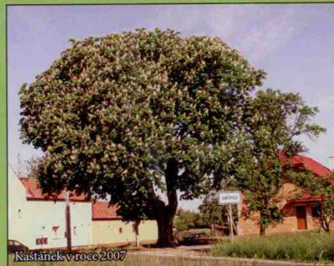
Kaštánek v roce 2007

KAŠTÁNEK odolával den co den, rok co rok nepříznivým vlivům