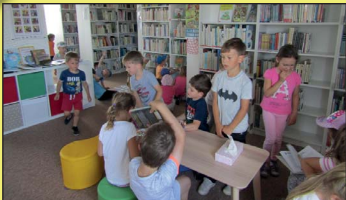
Slavnostní otevření knihovny