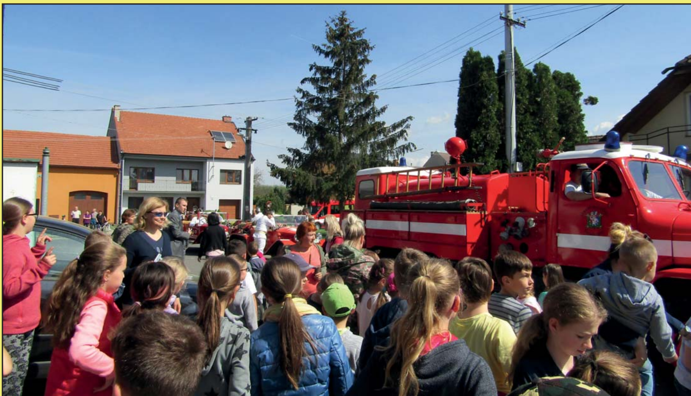
Propagační jízda historické hasičské techniky