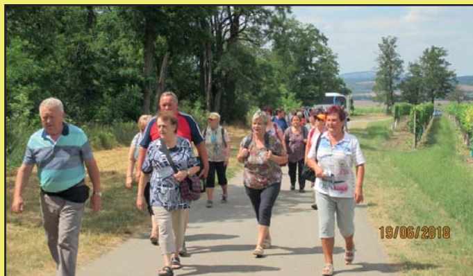
Zájezd pro seniory