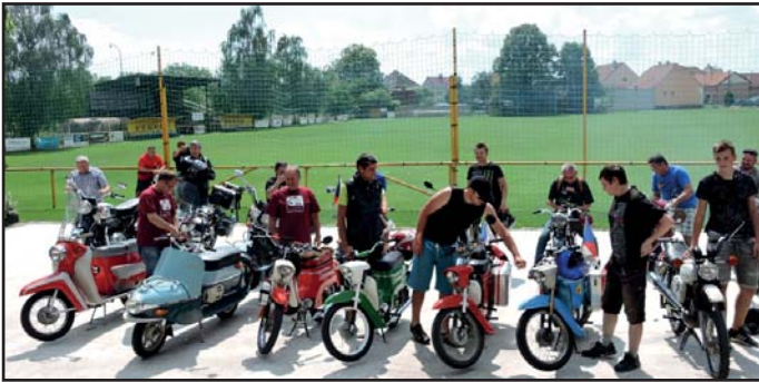
1. spanilá jízda motocyklů v Kněžpoli