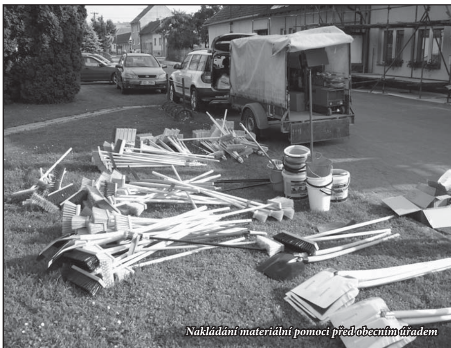
Nakládání materiální pomoci před obecním úřadem

Zprávu o expedici sepsal a fotkama doplnil Petr Jakšík