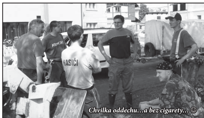
Chvilka oddechu...a bez cigarety... ☺