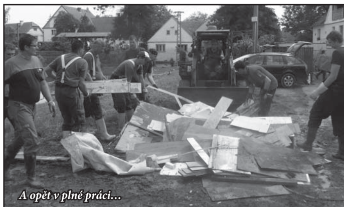
A opět v plné práci...