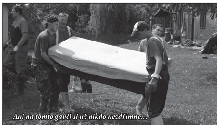
Ani na tomto gauči si už nikdo nezdřímne...