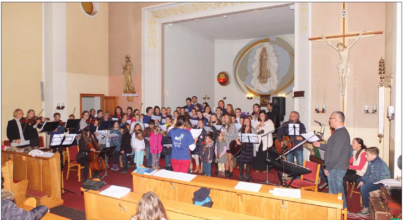
Přehlídka shol farností Bílovice a Březolupy