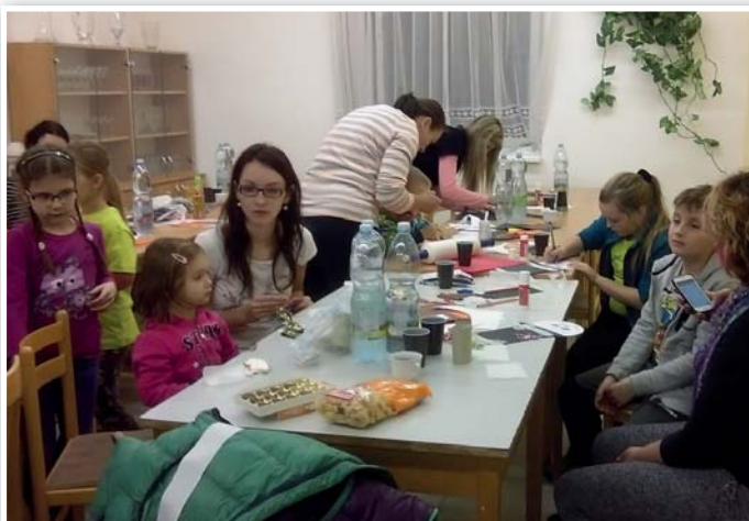
Vánoční tvořivé dílničky pro děti