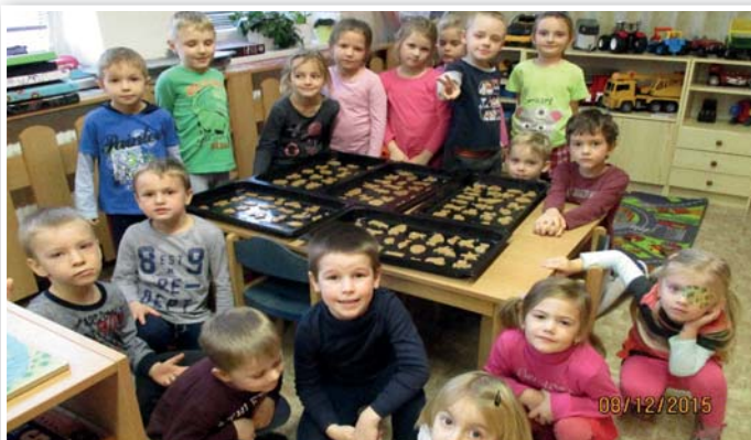
Mateřská škola - třída srdíček