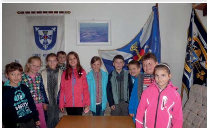
Základní škola na návštěvě na Obecním úřadě