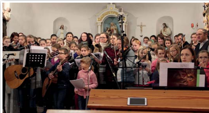
Cecilka 2015 - Přehlídka schol farnosti Bílovice