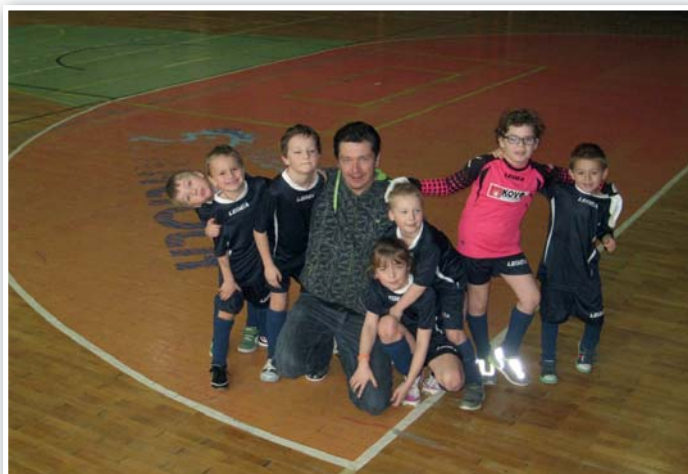
Mikulášský turnaj v Hluku - Fotbalová příprava