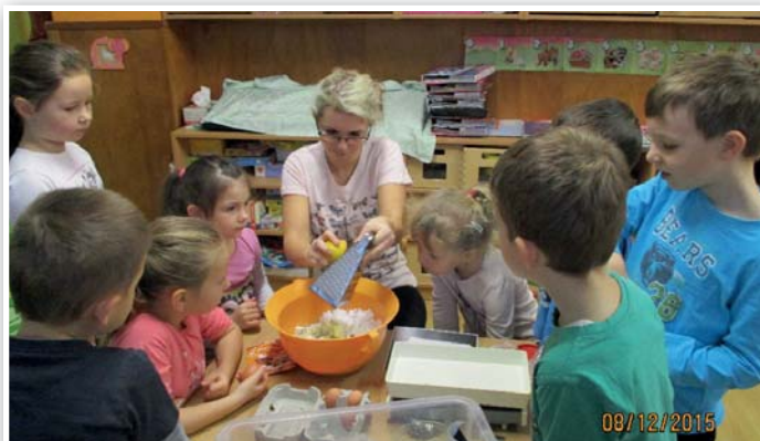
Mateřská škola - třída motýlků