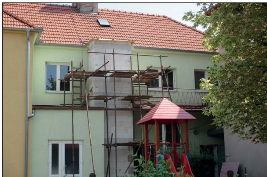
výstavba výtahu – budova mateřské školy

Poslední rok volebního období se pokračovalo v budování a rozvoji naší obce. Začátkem září se dokončila výstavba výtahu pro školní kuchyni . Dodavatelem byla f. EURO-VÝTAHY s.r.o. Celá akce stála 717.387,25 Kč.