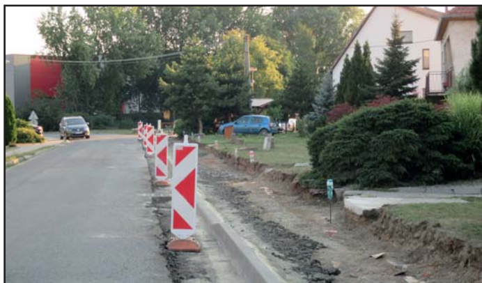
oprava chodníku od čp. 171 po čp. 303

Byla dokončena oprava chodníků od čp. 303 po čp. 171 a v září započata oprava chodníků v ulici Trávníky včetně opravy komunikace . Dodavatelem je f. STRABAG a.s. Náklady na tyto opravy dosáhnou částky 3.113 538,99 Kč. Celkem bude opraveno cca 220 m silnic 450 m 2 chodníků.