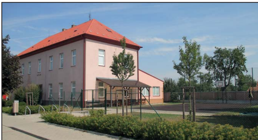
prostor před základní školou