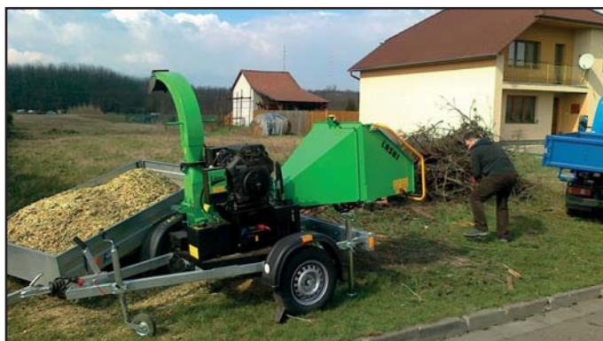
štěpkovač LASCI v akci

Projekt byl spolufinancován z Operačního programu životní prostředí a byl zaměřen na sběr rostlinných zbytků z údržby zeleně a ze zahrad občanů v obci. V rámci projektu byl zakoupen Štěpkovač LASCI, nosič kontejnerů Mitsubishi Fuso Canter, 2 ks kontejnerů o objemu 4 m 3 a 1 ks kontejneru o objemu 2,5 m 3 . Zahájení realizace projektu bylo v červenci 2015 a projekt byl ukončen v říjnu 2015. Celkové náklady činily 1.554.483,-Kč, z toho získaná dotace z Fondu soudržnosti 1.306.168,65 Kč, dotace ze Státního fondu životního prostředí 76.832,99 Kč a vlastní zdroje obce ve výši 171.483,36 Kč.