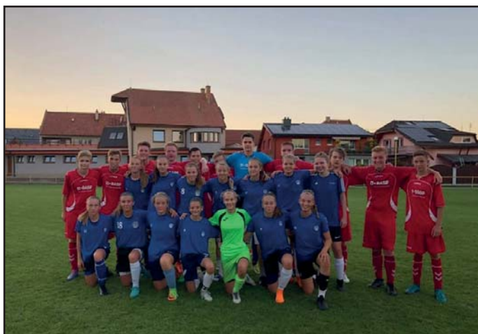
Tréninkové utkání dorostu TJ Sokol Kněžpole proti dorostenkám 1.FC Slovácko