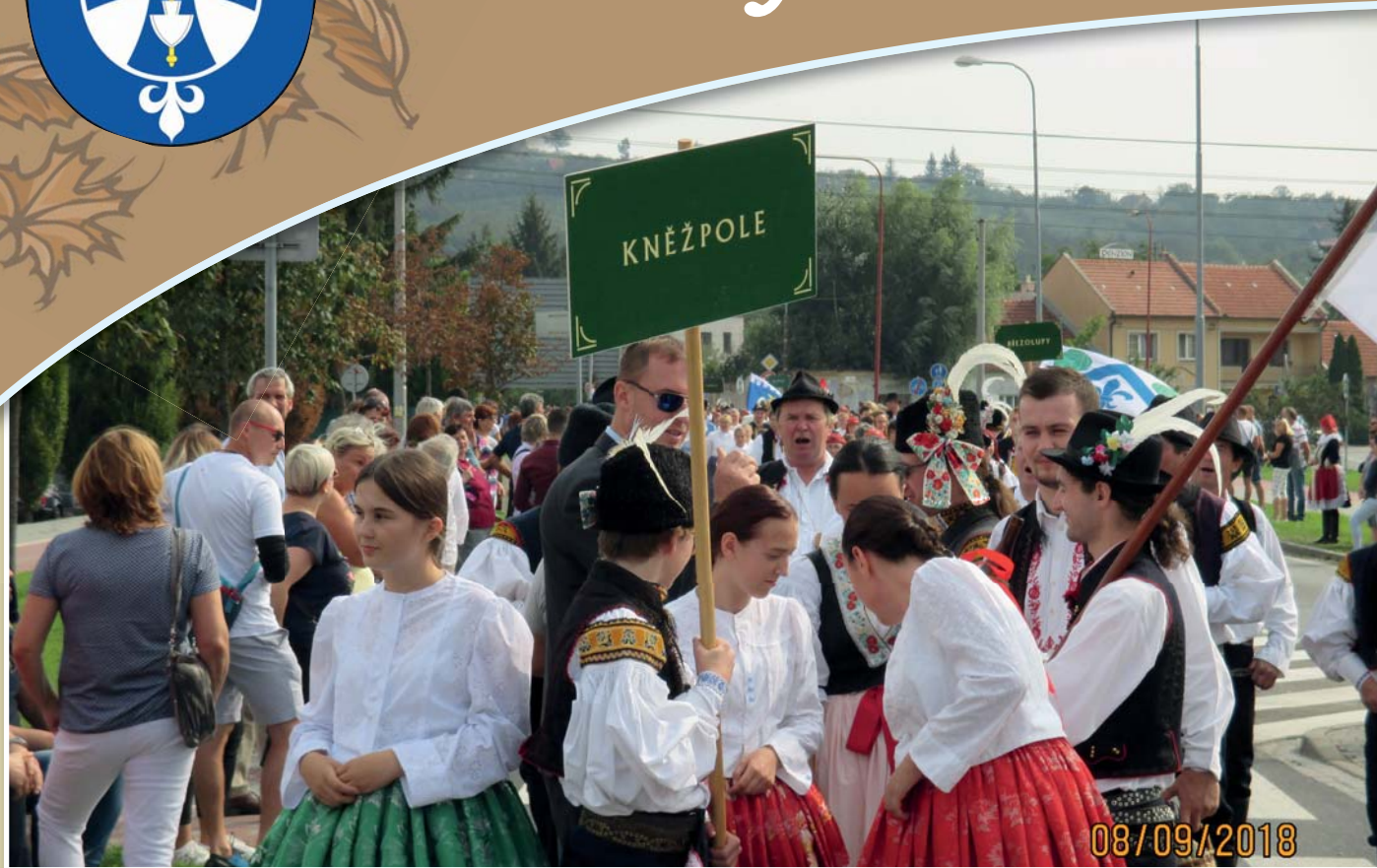
Slovácké slavnosti vína