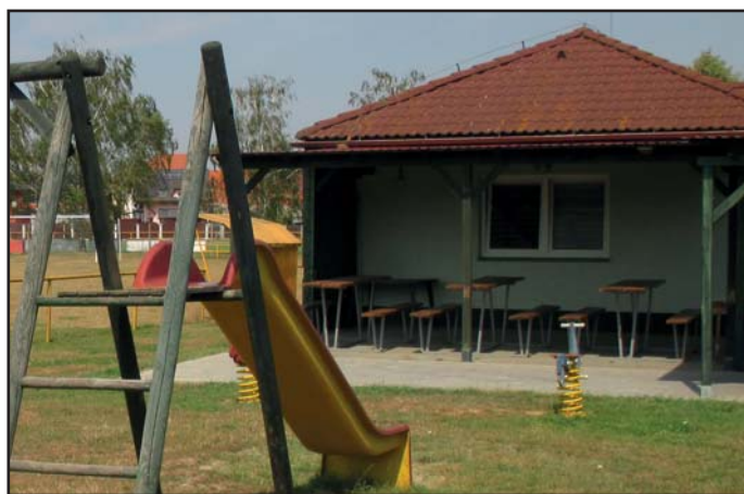
zpevněná plocha tenisové kurty

V součtu bylo v roce 2017 vynaloženo na investiční akce 170.977,59 Kč, na opravy 3.305.992,16 Kč. Příspěvková organizace Základní škola a Mateřská škola Kněžpole obdržela příspěvek ve výši 1.166.000,00 Kč, místním a ostatním spolkům a organizacím byla poskytnuta neinvestiční dotace ve výši 476.000,00 Kč a ostatní provozní náklady činily 5.416.977,01 Kč. Celkové příjmy v roce 2017 činily 14.735.483,93 Kč (včetně poskytnutých dotací + I. části průtokového transferu pro ZŠ a MŠ Kněžpole z Operačního programu Výzkum, vývoj a vzdělávání, Ministerstva školství, mládeže a tělovýchovy – 332.328,60 Kč).