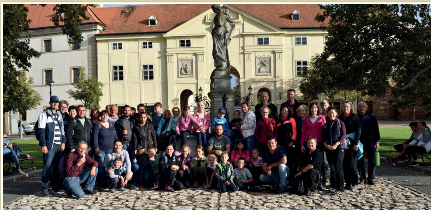
3. ročník turistického výletu Cestou necestou bosou nohou