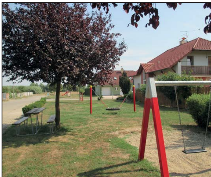
dětské hřiště Markov

Na opravy a investiční akce bylo vynaloženo celkem 10.361.920,34 Kč. Příspěvková organizace Základní škola a Mateřská škola Kněžpole obdržela příspěvek ve výši 1.166.000,00 Kč, místním a ostatním spolkům a organizacím byla poskytnuta neinvestiční dotace ve výši 471.500,00 Kč a ostatní provozní náklady činily 5.312.340,63 Kč. Celkové příjmy v roce 2015 činily 16.033.397,30 Kč (včetně poskytnutých dotací).