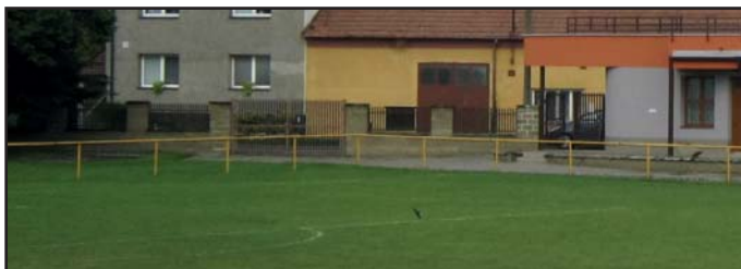
původní plot u fotbalového hřiště

Kromě výše uvedeného obec koupila do svého vlastnictví dům čp. 65 – (vedle budovy OÚ), vybudovala veřejné osvětlení k novostavbám na Markově – směr k lesu, byly pořízeny nové herní prvky na hřišti na Markově a u budovy MŠ, starý cihlo-dřevěný plot u fotbalového hřiště byl nahrazen nových železným plotem, opraven chodník od čp. 180 po čp. 188, opraven pomník padlých.