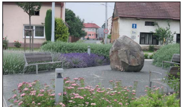
u křižovatky směr Uherské Hradiště – po demolici domu čp.98