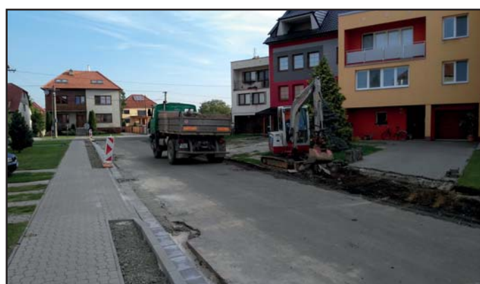
ulice Trávníky – příprava na opravu komunikace a chodníků