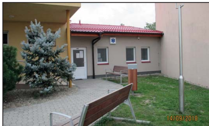
přístavba kulturního zařízení - zdravotní středisko

a ostatní provozní náklady činily 5.289.207,52 Kč. Celkové příjmy v roce 2016 činily 16.397.879,72 Kč (včetně poskytnutých dotací- doplatek dotace na akci revitalizace + dotace knihovna).