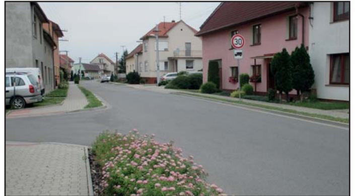
Pohled na „Revitalizaci“ v roce 2015 a v roce 2018