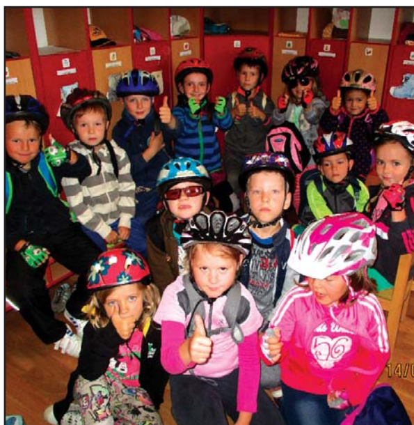
Mateřská škola - cyklovýlet třída Srdíček