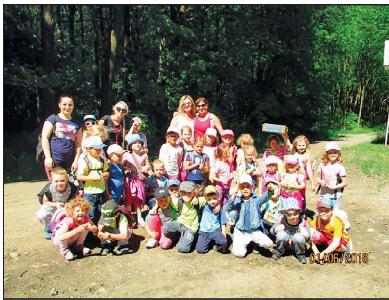
Mateřská škola - Den dětí v kněžpolském lese