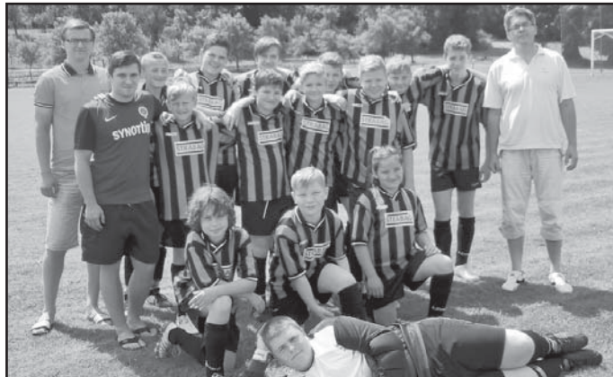
Oddíl žáků Kněžpole 2016