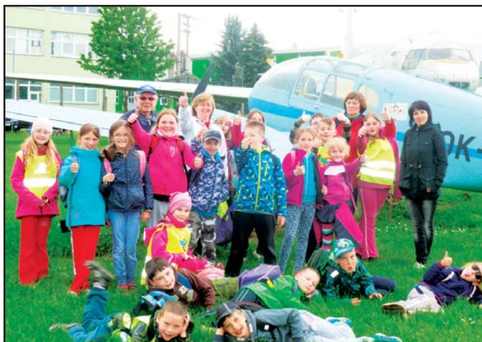
Základní škola - škola v přírodě