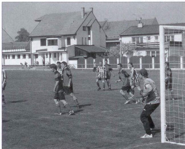
Kněžpole – Nivnice, zápas dorostenců