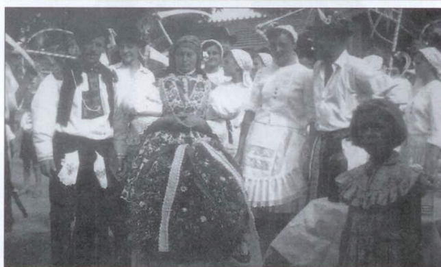
Hospodáři 1945 a hospodáři 1957)

Obsluha mlátičky sestávala z osoby, která stála do mlátičky snopy, které jí podával někdo, kdo stál na fůře, rozvazoval snopy a podával jí je. Vymláčená sláma pak z mlátičky odcházela samovazem, kde byly otěpky odebrány a podávaly se na připravený vůz, který pak slámu odvázel k hospodáři. U pytlu s obilím byl zpravidla hospodář. Výfukem od mlátičky se kupily velké hromady plev, které si pak hospodáři odváželi a přidávali do krmení pro dobytek.