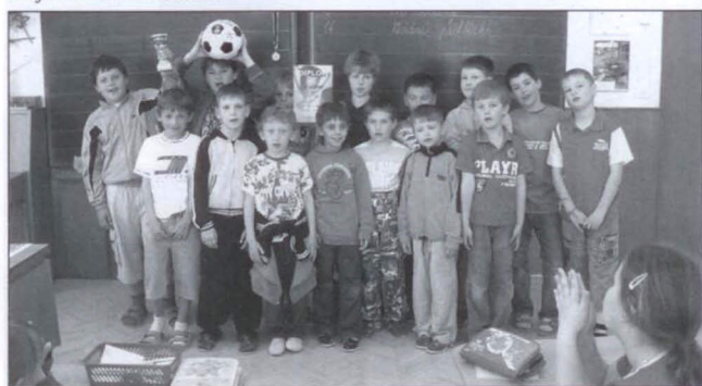
Družstvo fotbalistu ZŠ získalo v turnaji 3. místo