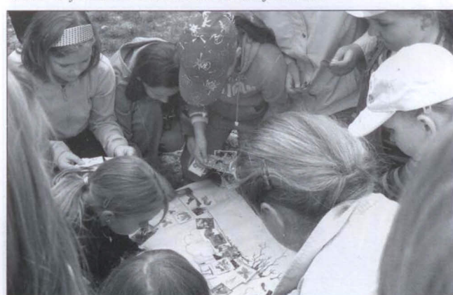
Poznávání lesa hrou