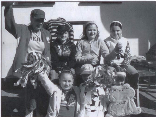
Na úspěchu se podílela také povzbuzující děvčata