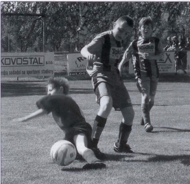
O každý míč se bojovalo s velkým nasazením

Reprezentanti naší školy a obce tentokrát rozhodně k favoritům nepatřili, ale ani to jim nic neubralo na bojovnosti a odhodlání dosáhnout co nejlepšího umístění. O tom, že námaha nakonec nebyla marná svědčí třetí místo v konečném účtování.