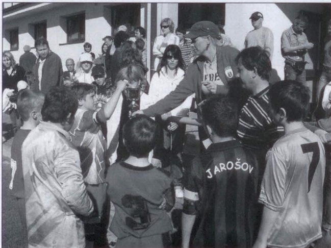
Kapitáni týmů rozlosovali účastníky do skupin