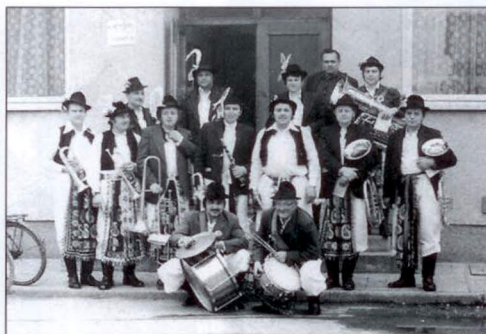
Hody v Kněžpoli 1978