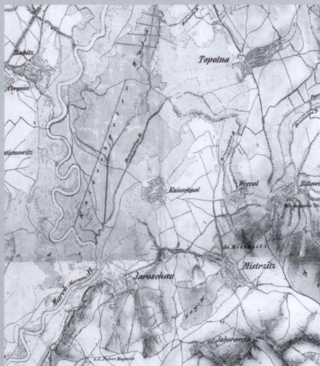
Ukázka historické mapy z r.1840 okolí Kněžpole a dnešní letecký snímek