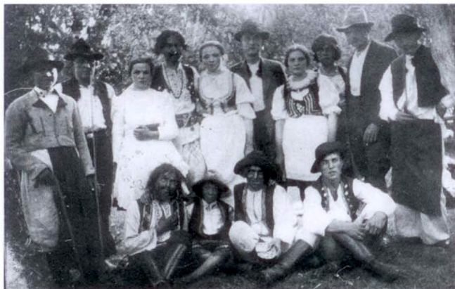
Ze hry Cigánčina pomsta