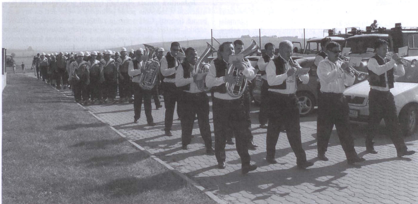
Celorepublikovému klání hasičů předcházelo slavnostní defilé soutěžních týmů.

Sbor dobrovolných hasičů prožil velmi rušné léto. Kromě toho, že pravidelně vyjížděl na soutěže, z nichž se vracel s poměrně slušnými výsledky (Pohár starosty města Uh. Hradiště - 6. místo z 24 družstev, Melúnový pohár Šarovy - 5. místo z 21 účastníků, Ořechovský pohár - 3. ze 12), počátkem září prošel zatěžkávací zkouškou, při níž musel projevit nejen mistrovství v požárním útoku, ale též značnou míru organizačních schopností.