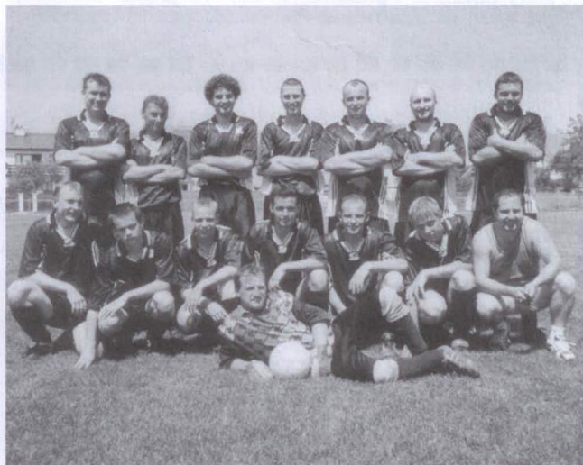
B tým alias Benfika

SPORT ● SPORT ● SPORT ● SPORT ● SPORT ● SPORT ● SPORT