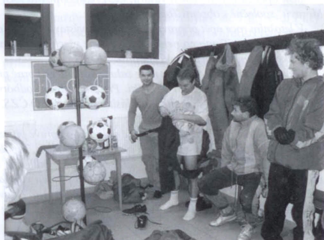
V kabině mužů vládla před zahájením zimní přípravy dobrá nálada.

Bude-li souhlasit také příroda, je připraveno zahájení mistrovských bojů na neděli 26. března v Bílovcích. Do té doby mají hoši naplánovány ještě následující zápasy: 12. března s Prakšicemi a 19. března s Nedachlebicemi. Začátky a místa konání budou upřesněna dodatečně podle aktuálního stavu hracích ploch.