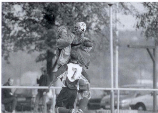
Doufejme, že v jarních zápasech budou k vidění pouze takové vítězné souboje.

Přestože fotbalové trávníky jsou ještě většinou pokryty sněhem a tudíž zejí prázdnou, fotbalisté nelení a velmi pilně se připravují na jarní část mistrovských soutěží. Platí to i o týmech kněžpolského Sokola, jejichž umístění po podzimní části soutěží pro pořádek připomenu. Žáci jsou zatím na 10. místě s ziskem 13 bodů, dorostenci na 12. místě s 12 body a tým mužů vede okresní přebor se ziskem 28 bodů.